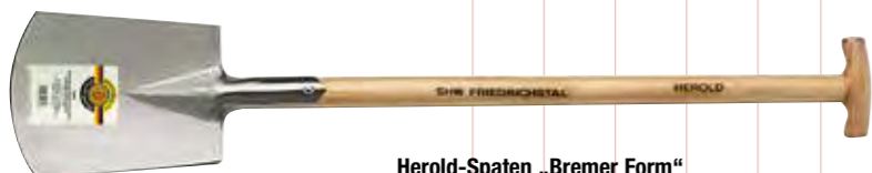
Herold-Spaten „Bremer Form“ 1/1 poliert, Doppelfeder