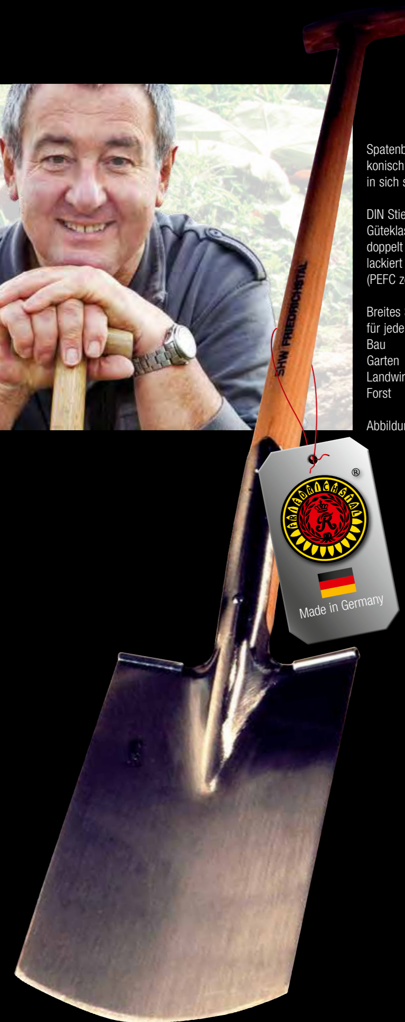
Abbildung zeigt Herold-Spaten.

Breites Sortiment für jeden Einsatzbereich: Bau Garten Landwirtschaft Forst