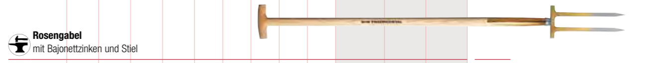
Rosengabel mit Bajonettzinken und Stiel