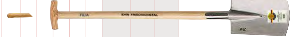
Filia-Spaten 1/1 poliert, hinten geschlossen